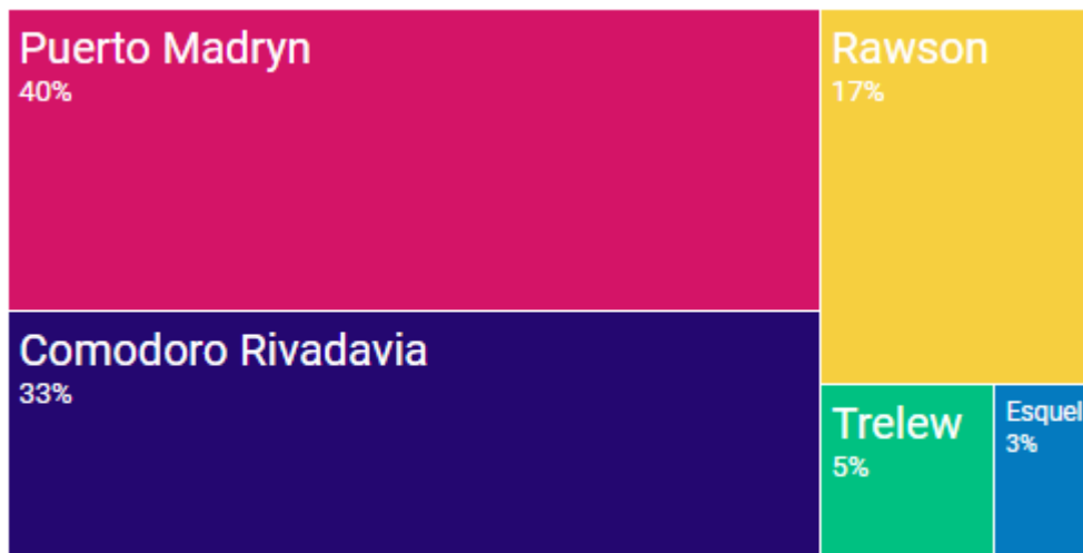
Gráfico n°2. Participación Relativa por Municipio del Total de la Superficie Cubierta Autorizada. 1° Trimestre 2017

Durante el segundo trimestre del 2017 se aprobaron 194.796 m 2 , de los cuales el municipio de Puerto Madryn posee una participación del 40,8% del total registrado, Comodoro Rivadavia con un 33,4%, mientras que el 25,8% corresponde a los municipios de Trelew, Rawson y Esquel.